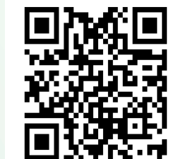
Speiseplan und Infos